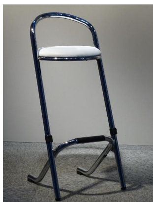
Artikelnr: BK651 Barkruk HRSB € 20,00