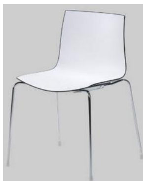
Artikelnr: S439 Stoel CATIFA € 28,50