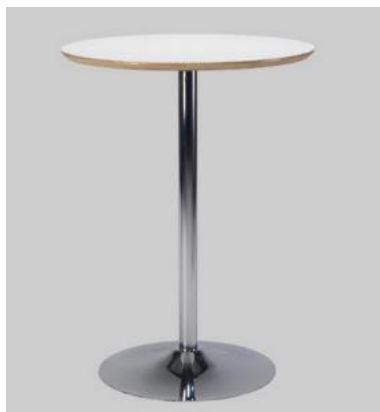
Artikelnr: T7512 Statafel TROMPET Ø80cm € 50,00