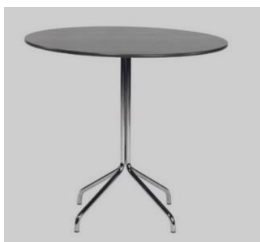
Artikelnr: T5411 Zittafel JENNER Ø80cm € 45,50