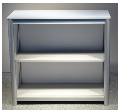
Artikelnr: BL530 Balie HRSB € 68,00